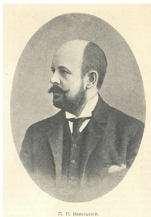
Рис. 2 Петр Петрович Извольский [7, с. 46]

Как оказалось, он принадлежал Петру Петровичу Извольскому (14.02.1863—09.12.1928 гг.), протоиерею, обер-прокурору Святейшего Синода, младшему брату Александра Петровича Извольского, министра иностранных дел России в 1906—1910 гг.